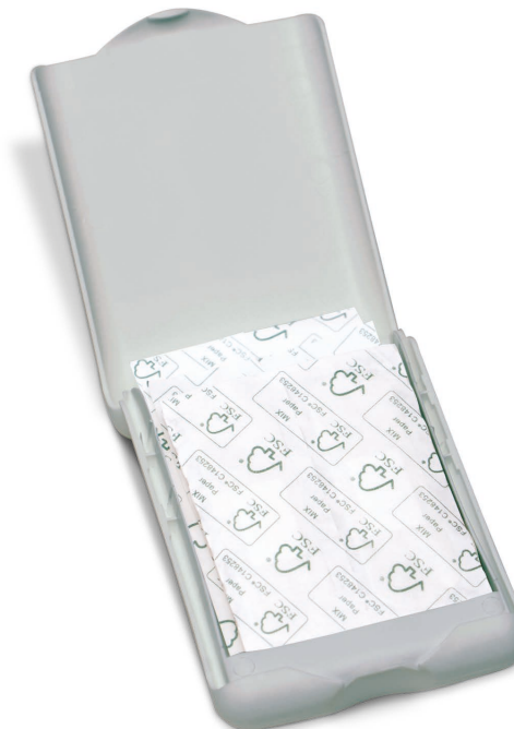
»ECO« Art.Nr. 1681