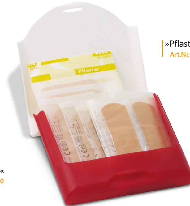
»Pflaster-Set« Art.Nr. 1580