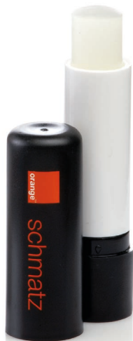
12 | vollschwarz