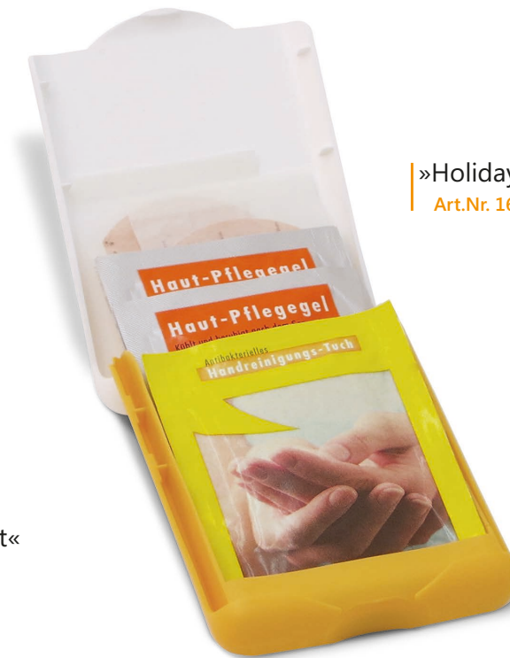
»Holiday« Art.Nr. 1661