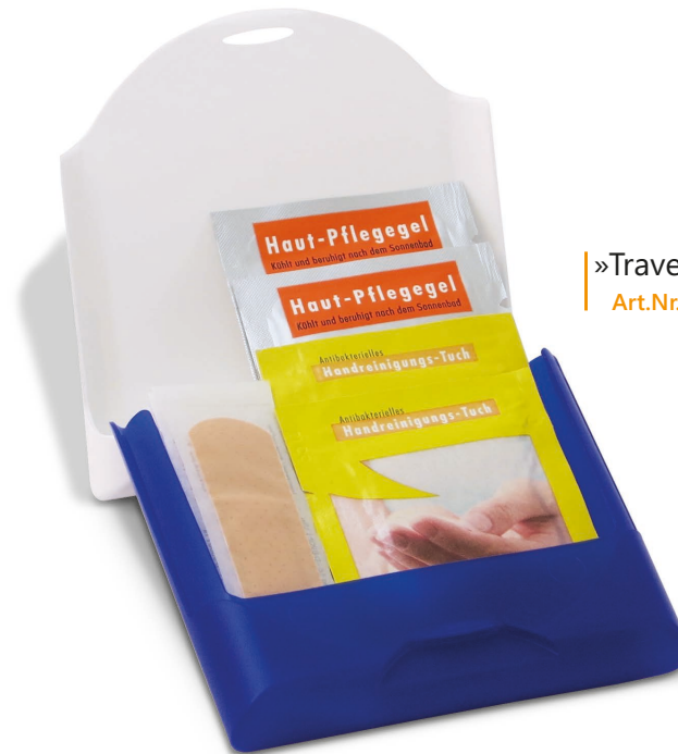
»Traveller« Art.Nr. 1560