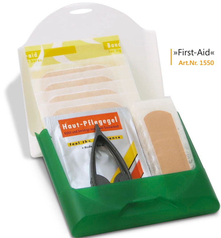
»First-Aid« Art.Nr. 1550