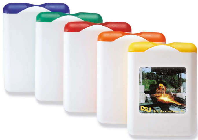
»First-Aid« Art.Nr. 1651