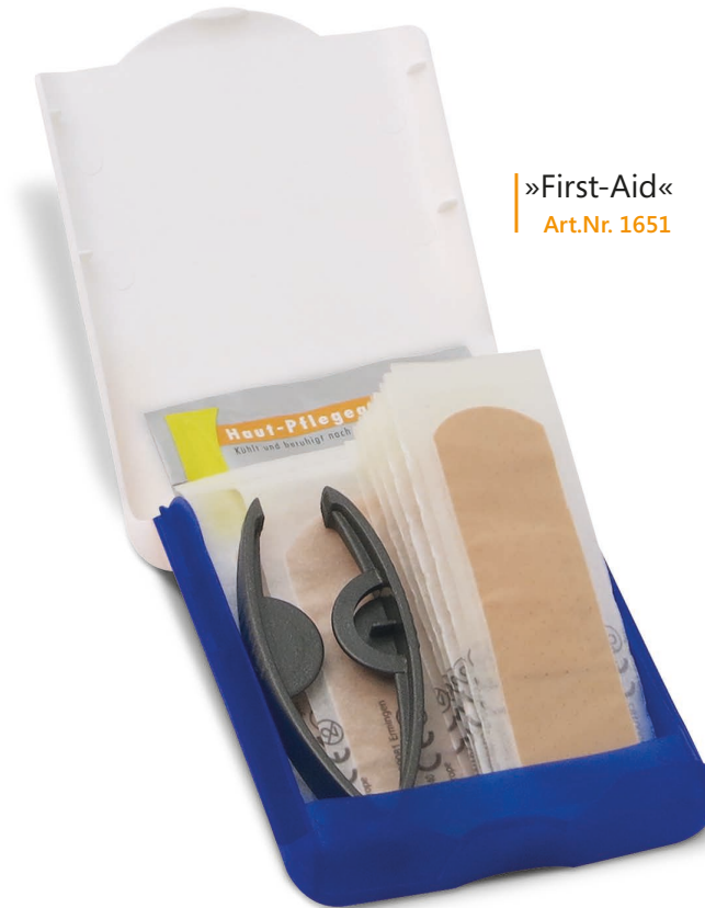
»First-Aid« Art.Nr. 1651