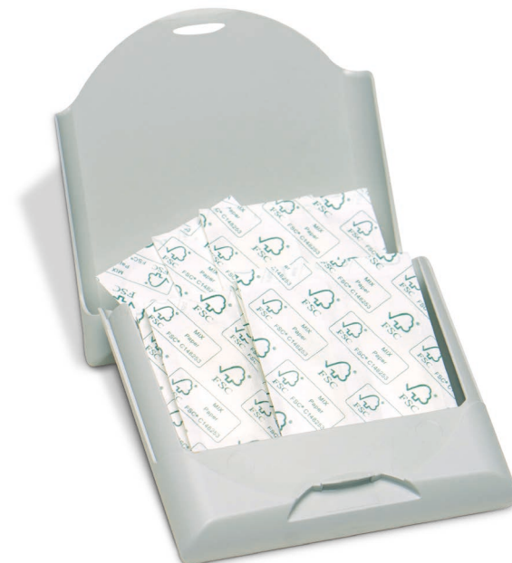
»ECO« Art.Nr. 1570