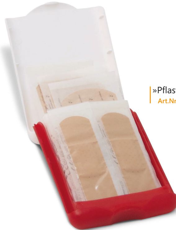
»Pflaster-Set« Art.Nr. 1671